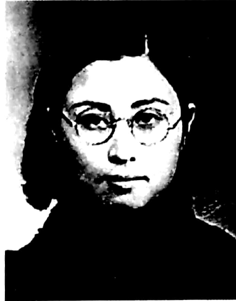
陳銜哲，考取清華留美學額，美國芝加哥大學碩士，1920年任中國第一位大學女教授