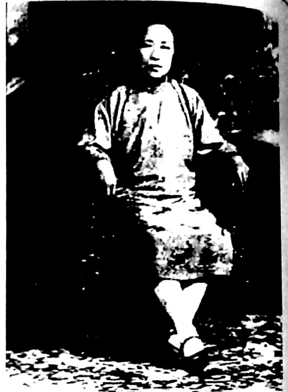
何香凝 同盟會會員