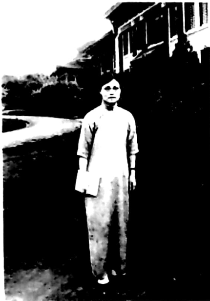
吳貽芳，中國第一批獲國內學士學位女大學生，1922年赴美國留學，1928年獲密西根大學生物學博士，自1928年起長期擔任金陵女子大學校長