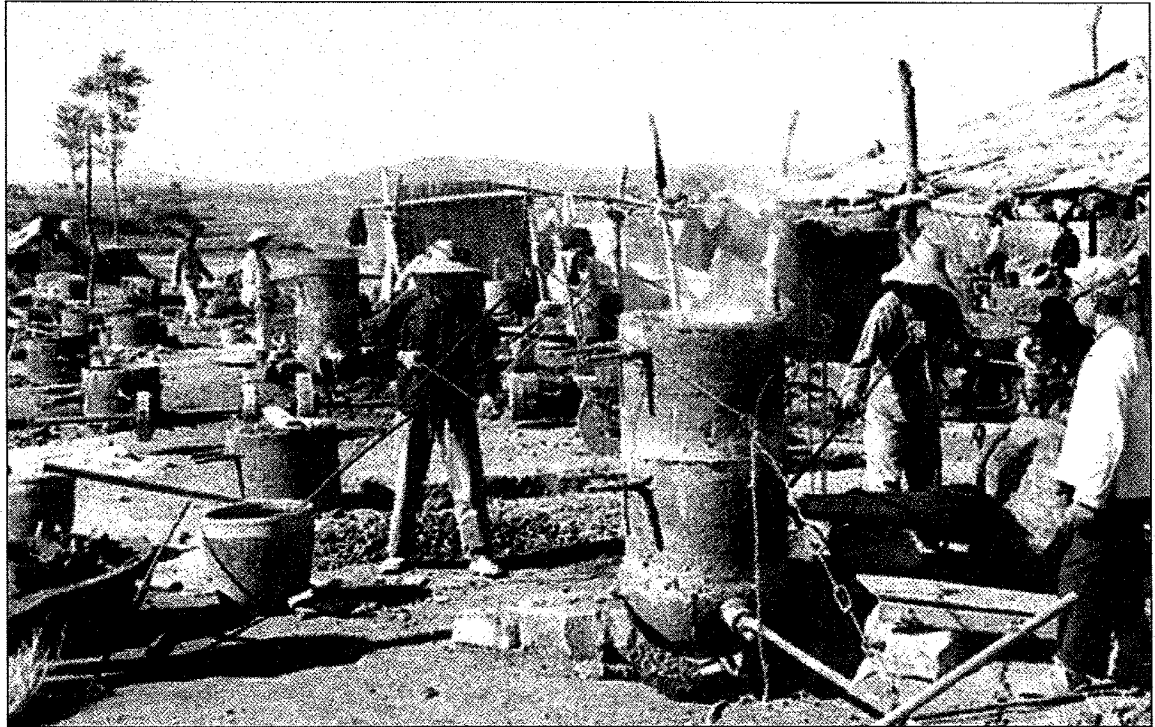
圖三：人民用小高爐煉鐵